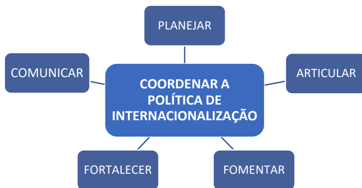
Figura 3. Processo administrativo da internacionalização.